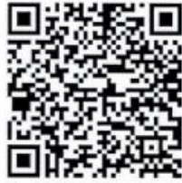
สิ่งที่ส่งมาด้วย ๒ และ ๓